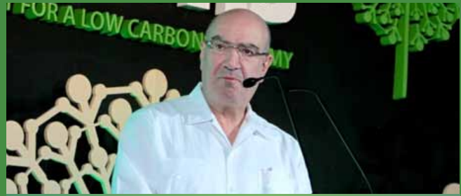
Juan José Guerra Abud, secretario de SEMARNAT