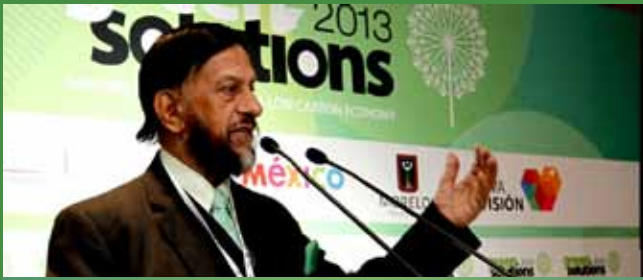
Rajendra K. Pachauri, Premio Nobel de la Paz en el año 2007