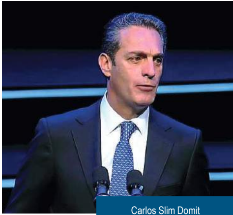
Carlos Slim Domit

justo en el que se debe invertir. Invertir en las personas, en su capacitación, en su crecimiento, en su entrenamiento. Para mí, mientras más invirtamos en las personas, mejores posibilidades tenemos en el futuro, tanto política, como económica, social y culturalmente. Todo depende de poner a las personas primero”.