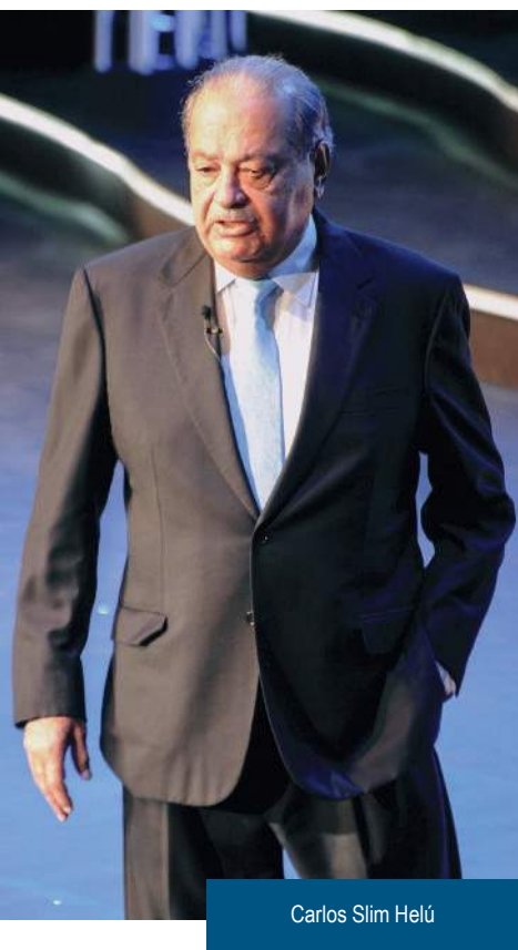
Carlos Slim Helú

Este 2015 no fue la excepción y #MexicoSigloXXI nombre de este evento convertido en hashtag para poder hablar de él en redes sociales, logró que personalidades como el actor, Al Pacino, el periodista y conductor estadounidense Larry King, el ganador de 22 medallas olímpicas Michael Phelps, el ex alcalde de N.Y. Rudolph W. Giuliani, el fundador de Snapchat, Evan Spiegel; Rosie Gumataotao Ríos, Tesorera de los Estados Unidos y el ingeniero Carlos Slim Helú, se dieran cita en el escenario del recinto nacional para compartir sus experiencias profesionales y de vida.