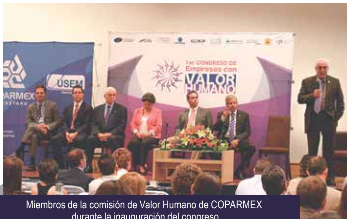
Miembros de la comisión de Valor Humano de COPARMEX durante la inauguración del congreso

COPARMEX Querétaro, Mauricio Kuri, resaltó que de las 800 empresas afiliadas a este organismo apenas 30 están certificadas como empresas con valor humano, pero se está trabajando para que se sumen cada vez más, ya que es precisamente la persona lo que hace la diferencia en la competitividad y productividad de las empresas.