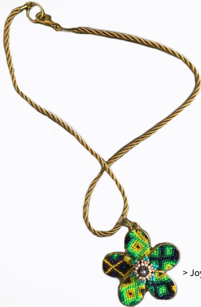
> Joyería Helguera

Capacitación de Facilitadores comunitarios y madres de familia, en temas de Salud, Nutrición y Estimulación para un mejor desarrollo en niños menores de 5 años. Los cuales habitan en comunidades rurales en los estados de Chiapas, Oaxaca, Sinaloa, Yucatán y Estado de México.